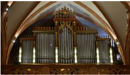
restaurierter Orgelprospekt Oktober 2025

Nun sind wir unserem Vater im Himmel von Herzen dankbar, dass wir die Innenrenovierung unserer Kirche mit der Orgelsanierung abschließen konnten.