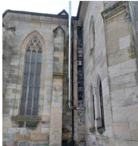
abgebauter Kamin Stadtkirche

Der Schwerpunkt aber soll sich nun auf unser Pfarrhaus in der Mozartstraße 9/Kirchstraße 20 verschieben.