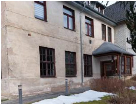
Ost-Fassade Pfarrhaus Mozartstr. 9

Im kommenden würden wir dann gerne die Fassade im Eingangsbereich zum Gemeindesaal und zur Mozartstraße hin renovieren. 2028 wäre dann die Fassade zum Garten hin und zur Kirchstraße hin samt Eingangsbereich zum Pfarramt an der Reihe. 2029 würden wir gerne die Fassade zum Hinterhof hin und den Gartenzaun neu machen. Und so Gott will setzen wir dann 2030 mit der Innenrenovierung der beiden Flur und Treppenhäuser den Schlusspunkt unter die Pfarrhaussanierung.