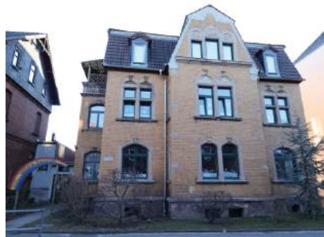
Straßenansicht Kiga „Unterm Regenbogen“

Nun stehen noch die Nord- und die Ostfassade aus. Die sind zwar in etwas besserem Zustand, brauchen aber dennoch eine Auffrischung. Das Gebäude des Kindergartens befindet sich im Besitz unserer Kirchengemeinde und darum sind wir für die Instandhaltung des Gebäudes verantwortlich.